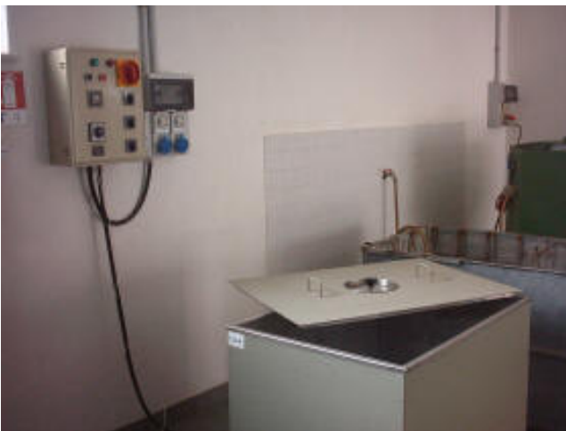
Vasca di maturazione accelerata per calcestruzzo