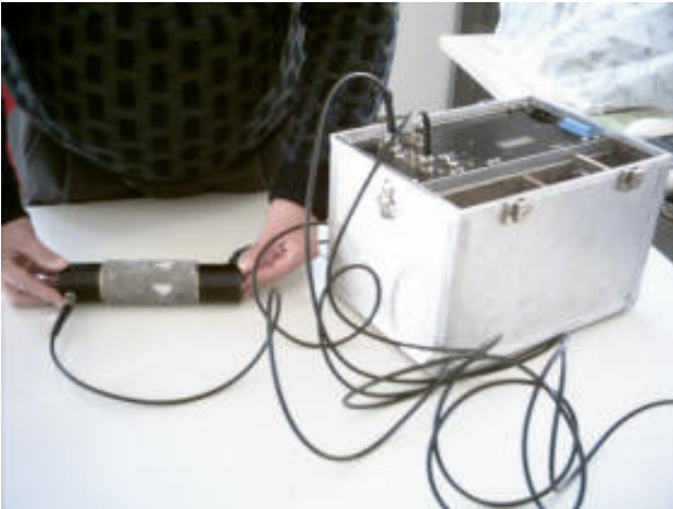
Misura della velocità del suono all'interno del calcestruzzo