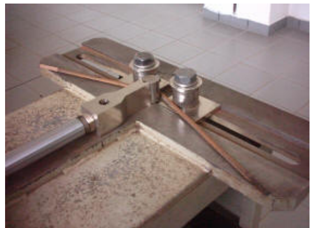
Prova di piegamento sulle barre di acciaio