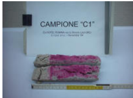
Determinazione della carbonatazione nel calcestruzzo