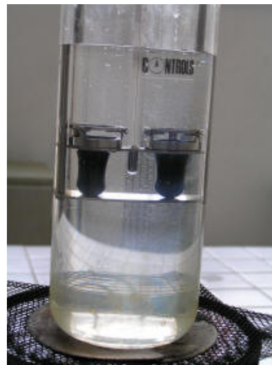
Punto di rammollimento (palla e anello)