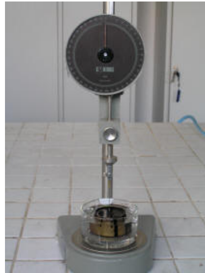
Estrazione di campioni dal manto stradale