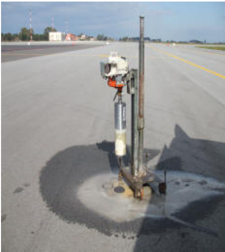
Prova di penetrazione su bitume liquido