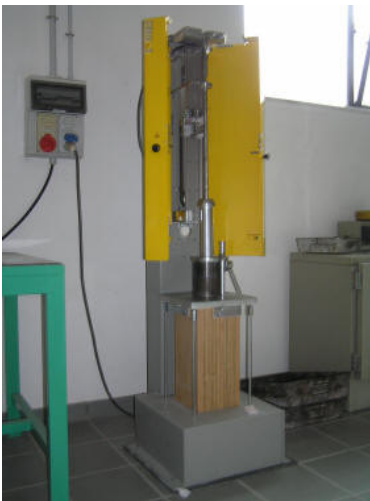
Compattatore Marshall automatico